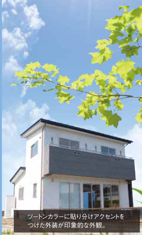
ツートンカラーに貼り分けアクセントをつけた外装が印象的な外観。